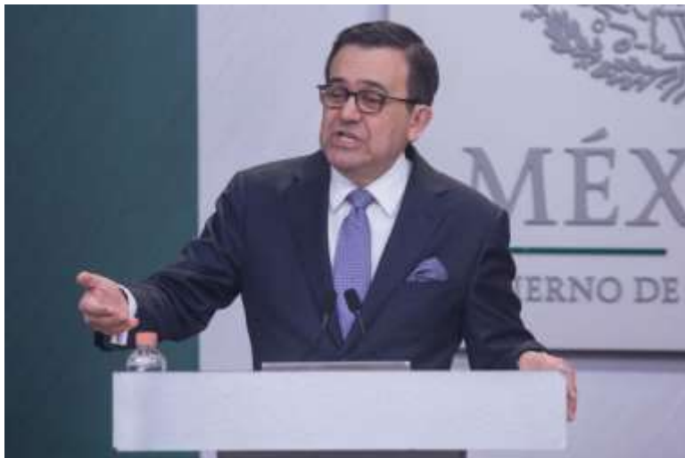
Medida espejo. Sectores aplauden la medida del Gobierno mexicano; se busca cobrar el daño por 3 mil mdd que éstos significarían para el país

Ante la aplicación de aranceles por parte del Gobierno mexicano a más de 70 productos de exportación estadounidense, como represalia por la implementación de impuestos al acero y aluminio, diversos sectores comerciales calificaron esta maniobra como acertada, misma que fue consensuada y no se buscó afectar a los consumidores.