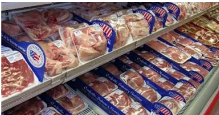
México, el principal consumidor de cerdo estadounidense