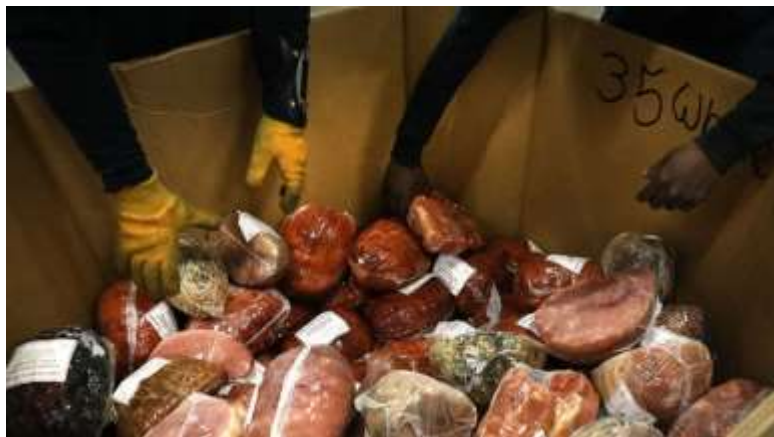
La industria porcina mexicana ya busca otras puertas comerciales.

En el primer año del Tratado de Libre Comercio, EUA exportó 8 mil toneladas de cerdo a México, hoy el incremento se disparó casi un tres mil por ciento por la rentabilidad y alta demanda del producto, según la Secretaría de Economía (SE). Por ello PORCIMEX pidió a la Secretaría de Economía integrar las piernas y paletas de cerdo mexicano en la lista de productos que podrían compensar las tarifas arancelarias anuales a favor de la economía mexicana.